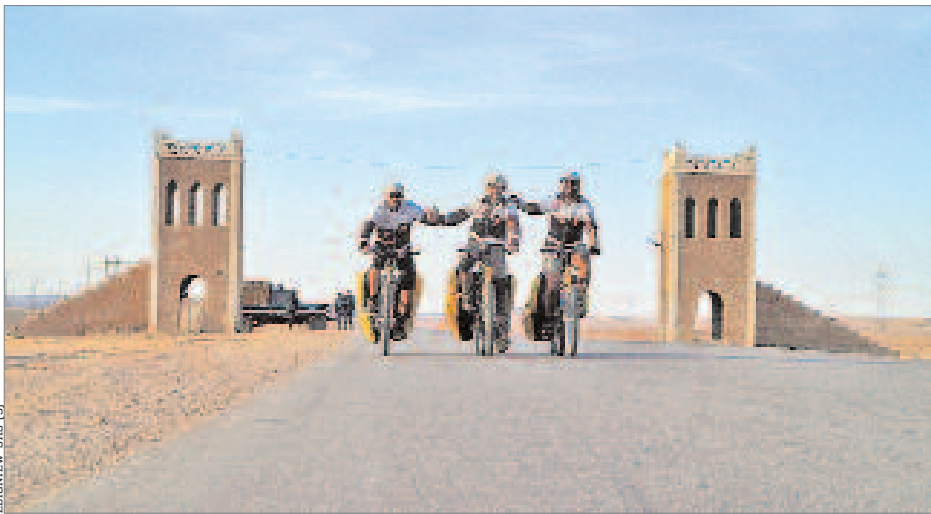
*Codzienne relacje uczestników podróży zamieszczane są na stronie www.afrykanowaka.pl

W słońcu i deszczu, po drogach, bezdrożach, przez busz i pustynię. Wczoraj upłynął 450. dzień sztafety przez Afrykę. Warszawiacy, którzy w niej uczestniczyli, myślą o jednym – jak wrócić na Czarny Łąd