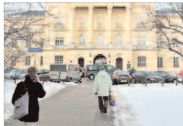
*Dziś w tym miejscu są chodnik i parking samochodowy